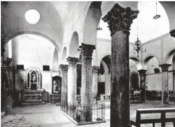
Chiesa di Santa Maria delle Cinque Torri o del Riparo: interno.