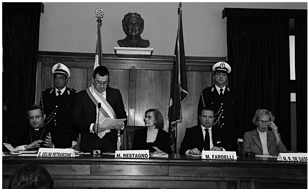
La commemorazione del sindaco.