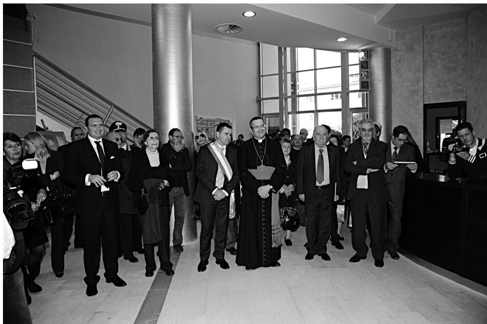
Le autorità in visita alla mostra fotografica.