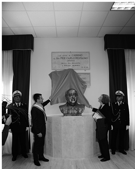
Il Sindaco e la Signora Restagno scoprono la nuova targa commemorativa.