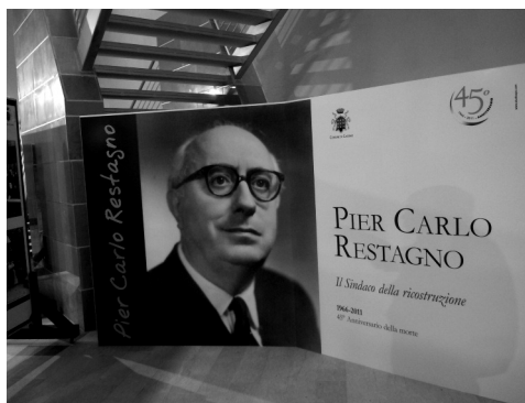
La mostra fotografica allestita nel foyer del Teatro Manzoni a cura del CDSC onlus.