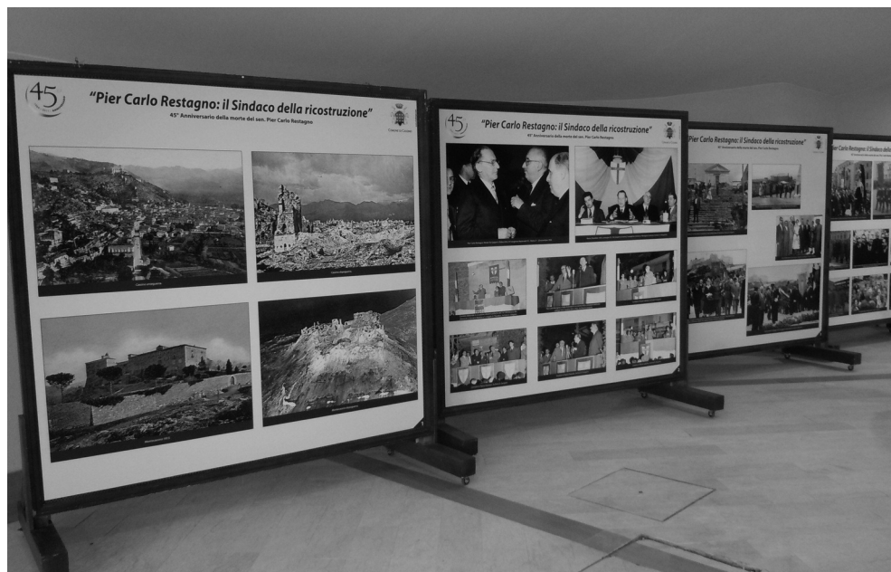
La sala mostra.