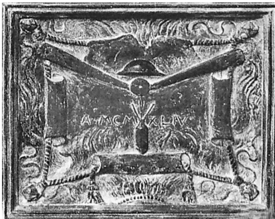
Particolare della formella inferiore della porta di destra.

aspetti della vita di S. Benedetto (la salita al monte del santo di Norcia; la costruzione del monastero; la cacciata dei demoni; il miracolo del santo taumaturgo; l'episodio del re goto Totila; il lavoro nei campi; la partenza dei monaci benedettini per il mondo) invece in ognuna delle formelle inferiori delle quattro valve sono simboleggiate le quattro distruzioni di Montecassino. Nelle due valve della porta di sinistra le prime due distruzioni, quella compiuta dai longobardi di Zotone del 582 e quella operata dai saraceni nell'883. Nelle due valve della porta di sinistra sono riprodotte le altre due distruzioni, quella determinata dal terremoto del 1349 e quella del 15 febbraio 1944. Per le formelle della distruzione la rappresentazione offre tratti simbolici dei responsabili: l'elmo longobardo e quello saraceno per le prime due distruzioni, un elmetto militare per l'ultima. In quest'ultima formella al di sotto dell'elmetto appare l'elica di un aeroplano e poi una bomba d'aereo che sta per deflagrare. Al centro la data in numeri romani «A MCMXLIV». Chiarissima l'allusione al devastante attacco aereo condotto da bombardieri e fortezze volanti e chiarissima l'allusione alle responsabilità degli anglo-americani e più nella fattispecie, con quell'elmetto britannico, agli inglesi.