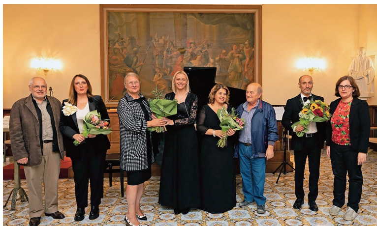
In alto: Un pannello della mostra.