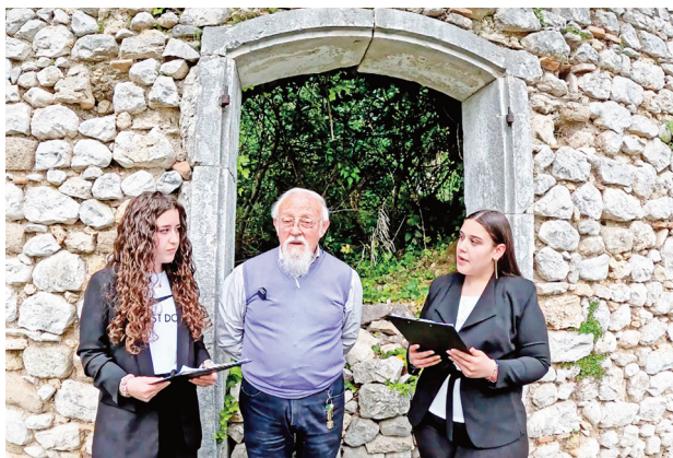
Fermo immagine di una delle interviste realizzate dalle alunne dell'IIS «Medaglia d'oro Città di Cassino» nella suggestiva cornice dell'abitato vecchio di San Pietro Infine.