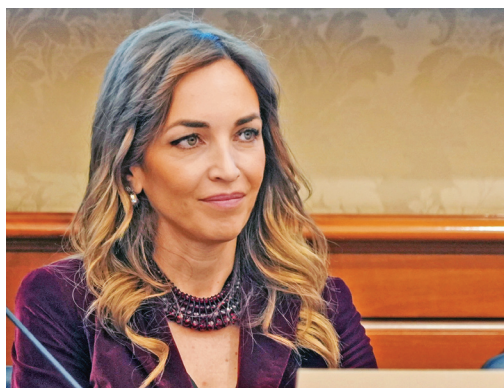
Sen. Mariolina Castellone.